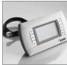
Система автоматического регулирования RENAУ RAUMATIC HC

Техника регулирования RENAУ RAUMATIC HC централизованно управляет и регулирует работу всех подключенных к ней компонентов RENAУ для поддержания комфортного микроклимата в обслуживаемых помещениях при низком энергопотреблении. Система может применяться для регулирования систем панельно-лучистого отопления и охлаждения: