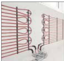
Система панельного обогрева обогрева поверхностей

В системе шумопоглощающей канализации RAUPIANO Plus используются трехслойные полимерные трубы с особо прочным средним слоем, обладающим высокими шумопоглощающими свойствами. Для уменьшения шума, передающегося по воздуху, трубы в местах сгибов имеют утолщенные стенки, а специальные крепежные хомуты препятствуют распространению звука по строительным конструкциям. Такая технология позволяет снизить шум от системы канализации RAUPIANO Plus на 30% и, кроме того, она совместима с другими видами канализации.