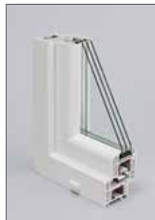
Профильная система DELIGHT-Design

Профильные системы Delight-/ и Sib-Design благодаря большому количеству камер способны выдержать экстремально низкие температуры. Испытания, проведенные специалистами ведущего отраслевого института НИИ Строительной Физики РААСН, показали неизменность рабочих характеристик системы под воздействием низких температур. Системы отличает высокий уровень воздухо- и водонепроницаемости: надежная защита от сквозняков, пыли и воды благодаря двум контурам уплотнений (нахлест уплотнений по 7/8 мм снаружи / внутри). Обе эти системы имеют значительные преимущества в климатических условиях Российской Федерации.