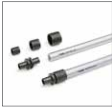
Универсальная труба RENAУ RAUTITAN для водоснабжения и отопления.

RAUTITAN PE-X – универсальная система полимерных труб и фитингов, применяемая в сетях отопления и питьевого водоснабжения. Долговечная, экономичная, пригодная для условий строительной площадки – вот основные достоинства системы RAUTITAN с гибкими трубами из сшитого полиэтилена. Техника соединения на надвижной гильзе обеспечивает прочность и долговечность соединений.