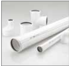
Шумопоглощающая канализационная труба RAUPIANO Plus.

RAUTITAN PE-X – универсальная система полимерных труб и фитингов, применяемая в сетях отопления и питьевого водоснабжения. Долговечная, экономичная, пригодная для условий строительной площадки – вот основные достоинства системы RAUTITAN с гибкими трубами из сшитого полиэтилена. Техника соединения на надвижной гильзе обеспечивает прочность и долговечность соединений.